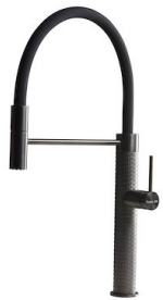
Mitigeur Skin Gun Metal 8424 856