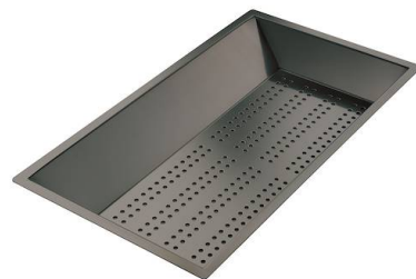
Cuvette perforée en acier inoxydable PVD Gun Metal 8151 006 * uniquement en combinaison avec l'accessoire 8644 101