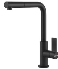
Mitigeur Omega Plus Matt Black 8498 626