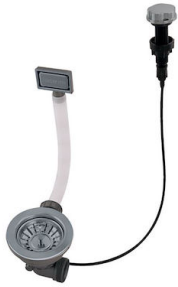
Vidange automatique Gun metal - PG