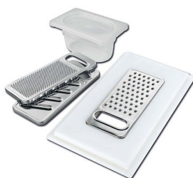
Kit râpes avec anneau de support et cuvette 8159 101 * uniquement en combinaison avec l'accessoire 8644 101