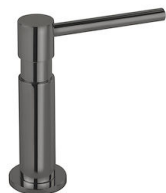
Dispenser Evo Gun Metal 8520 856