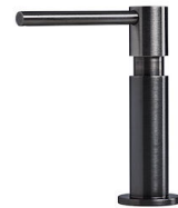
Dispenser Evo satiné Gun Metal 8520 156