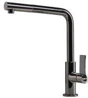
Mitigeur Omega Plus Gun Metal 8498 856