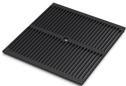
Black grille 8100 617