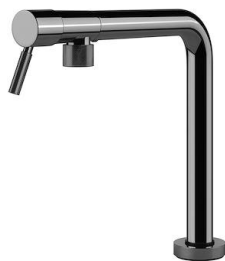
Mitigeur Margot Gun Metal 8524 006