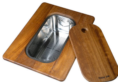
Planche de découpe Twin en bois Iroko avec tamis en acier inoxydable 8644 044