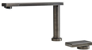
OP GUN METAL satiné 8499 106